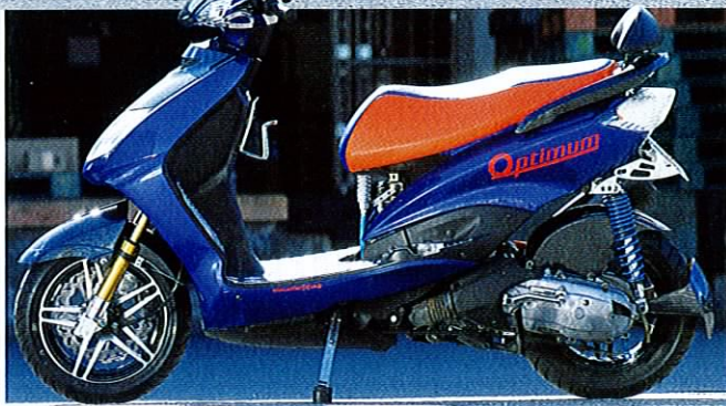
●オプティマム (カスタムジャパン ☎06-6722-5166)

① ハンドルカーボンカバーとカーボンフロントカウル(どちらも残念ながら非売品)をはじめ、カーボンフロントフェンダー(7245円)でドレスアップ。② 開発中のゴールドフロントフォークに、ヘビーウェーブディスクローター260mm(1万3440円)の組み合わせ。ブラックアーバンホイールは廃版となっている。③ シート下にはオイルクーラーKIT Ver.2(3万2550円)を装備。④ CNC加工軽量リアアームオレンジ(5万2290円)、リアアームスクリューカバー(4179円)、カーボンリアフェンダー両持タイプ(7245円)、軽量オレンジファン(5229円)などで彩られたリヤ周り。エンジンはボアアップ最速最強187cc3点セット(6万2790円)で強化。⑤ ガルウィングタンデムステップ(1万7640円)はタンデム時に便利なアイテム。⑥ フェンダーレス化の際に使用したいナンバプレートブラケット(8190円)。⑦ K&S前後アルミステップ(各3129円)、アルミステップボード沢尻金属地(1万2600円)を組み合わせたステップ周り。⑧ 街乗りで重宝するドリンクホルダー(1344円)。